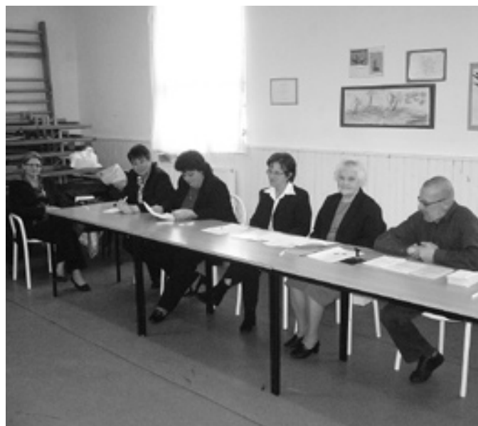
Munkában a választási bizottság.

2008. március 9-ére országos népszavazást tűzött ki a köztársasági elnök 3 kérdéscsoportban. Náraiban a szavazás összesített adatai a jegyzőkönyvek hitelesítése után a következőképpen alakultak: a szavazást megelőző nap 16 óráig a névjegyzékbe felvett választópolgárok száma 922 fő volt, a szavazás napján a névjegyzékbe igazolás alapján felvett választópolgárok száma 3 fő, így tehát a választópolgárok száma a névjegyzékben a szavazás befejezésekor 925 fő volt. Ebből a szavazóként megjelent választópolgárok száma 533 fő volt.