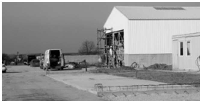
Épül a komposztáló

zségünk határában, tudtuk meg a szakemberektől. A komposztálási technológiák közül a zárt szempermeábilis membránnal takart, levegőztetett prizmás rendszerre esett a választás, mert ez a rendszer egyszerű, könnyen kivitelezhető, megfelel a hazai műszaki színvonalnak és megfelel a környezetvédelmi követelményeknek is. Ennél az eljárásnál az iszaphoz a megfelelő nedves-