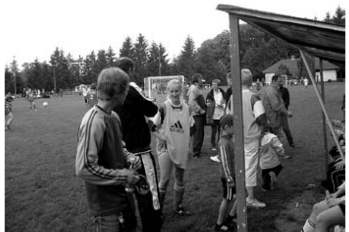
Kicsit elfáradtunk, jólesik egy kis pihenő.