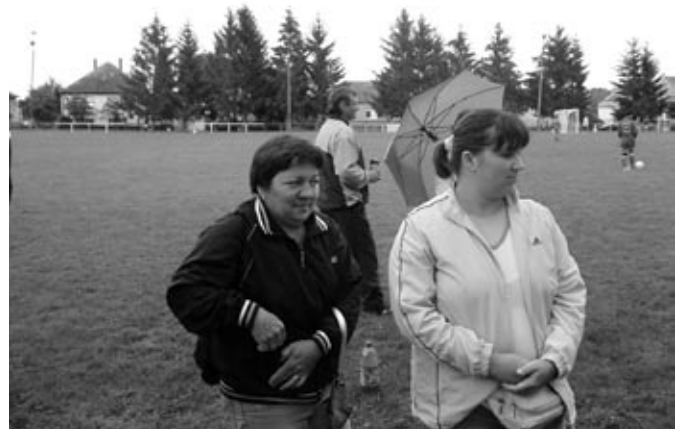
Ha kell, mi is beállunk!