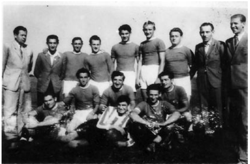
A képen az 1947–48-as nárai focicsapat látható

A szép és jó mérkőzésekhez persze megfelelő felszerelések kellenek, ami az első időszakban nem volt. Glottgatyában, felső ingben, bakancsban játszottunk. De azért fokozatosan kialakult a csapat. Fordulatot jelentett az, hogy Budapestről egy dohánygyári futballcsapat jött le, és ajándékban hoztak egy csapatnyi felszerelést. Ettől kezdve lettünk „zöld-fehér ifjak”. 1947-1950-ig sok mérkőzést játszottunk. Jó csapatunk volt. Játszottunk például: Jákon, Szentpéterfán, Újperinten, Oladon, Szombathelyen, Pornón stb. Legtöbbször győztünk. A budapesti dohánygyári csapatot 4:1-re vertük, pedig kicsit le is becsültek bennünket. Nagyon jó Nárai drukker közönségünk volt. Egy-egy meccsen 150-200-an is voltak. Belépődíj 1 forint volt. A játékosok anyagi juttatásban nem részesültek, saját maguk is nagyon élvezték a futballt. Pedig sok vidéki játékosunk is volt. Jöttek biciklivel Séből, Oladból, Pornóból, Szombathelyről. Mi is, ha mentünk vidékre a járműünk kerékpár és lovas kocsival. Hát így született, alakult a Nárai futballcsapat az 1950-es évekig.