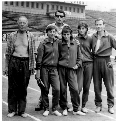
Országos Sportnapok a Népstadionban

„1939. július 7-én születtem Náraiban. Szüleim és tanárain segítségével határoztam el, hogy pedagógus leszek. 1958-ban szereztem tanítói oklevelet, majd történelemből felsőfokú tanári végzettséget 1970-ben. Sorkifaludra kerültem tanítani, majd 1959-től 1977-ig szülőfalumban dolgoztam. Pedagógiai munkám elismeréseként 1965-ben, 26 évesen a megye legfiatalabb igazgatója lettem. Általános isko-