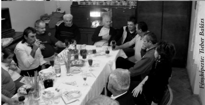
2008. szeptember 21-ei egyházközségi gyűlésre a tagok családtagjai is meghívót kaptak