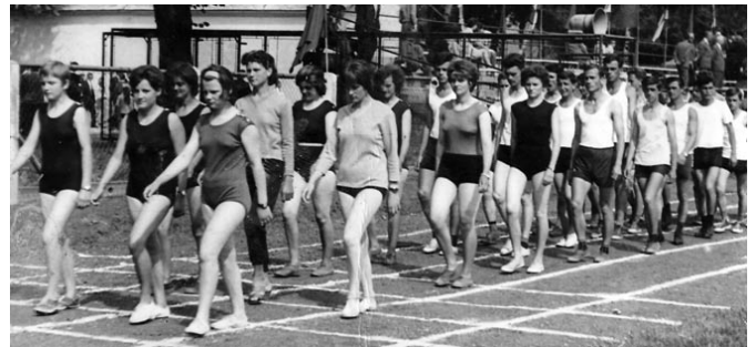
Megeyi tömegsport-döntő Kőszegen

tika, kézilabda, tömegsport. Volt olyan megyei döntő Kőszegen, ahol 60 versenyzővel vettünk részt. Az Országos Sportnapokra is eljutottunk, a Népstadionban versenyeztünk. Labdarúgóimmal a megyei első osztályig jutottunk. Több évig magam is rúgtam a labdát, majd a csapat edzője lettem. Hoszszú évek során vezettem a Balatonberényi Úttörőtábort, 300 résztvevővel és a megyei Vöröskeresztes tábor. Pedagógiai és társadalmi munkámat jutalommal és kitüntetéssel ismerték el. 1977-ben kerültem Szombathelyre, ahol a város művelődésének irányításában kaptam szerepet az óvodától a főiskoláig. 1984-ben választottak meg a Dózsa György Általános Iskola igazgatójának. Tizenegy évig irányítottam az iskola oktató-nevelő munkáját. Az iskola megszűnésével mentem nyugdíjba. Ezután még öt évig voltam Náraiban a kultúrotthon igazgatója. Most már csak a nyugdíjasok nyugodt, csendes életét élem.”